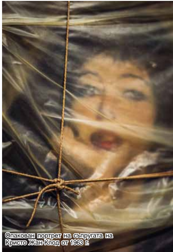
Опакован портрет на съпругата на Кристо Жан-Клод от 1963 г.

За опаковането на арката, която е по-висока от Райхстага в Берлин, който Кристо покори през 1995 г., ще са нужни 270 000 кв. м пропиленов материал. Покрит е с пулверизиран алуминиум, за да му се придаде сребърен син блясък. Материята ще бъде закрепена с около 3.7 км червено въже – анонс към цветовете на френското знаме. Владимир Явашев смята, че проектът ще струва между 12 и 14 милиона евро, 13.5-16 милиона долара. Той допълва, че има и други предизвикателства. Техниците ще трябва да монтират и специална платформа, така че нощните церемонии в чест на Незнайния