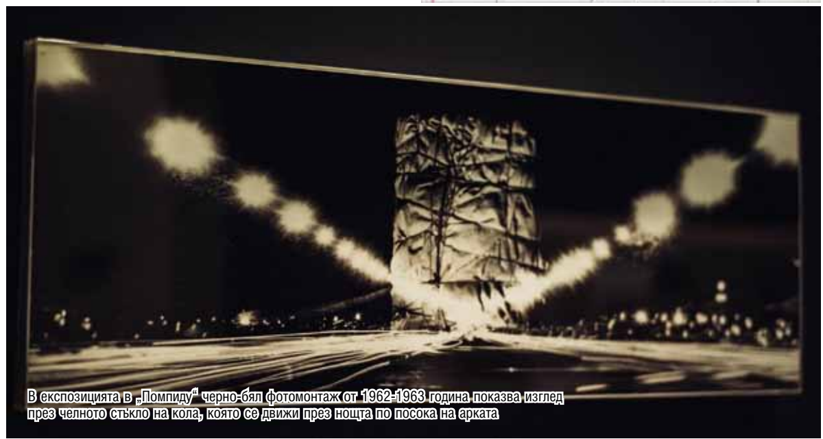
В експозицията в „Помпиду“ черно-бял фотомонтаж от 1962-1963 година показва изглед през челното стъкло на кола, която се движи през нощта по посока на арката