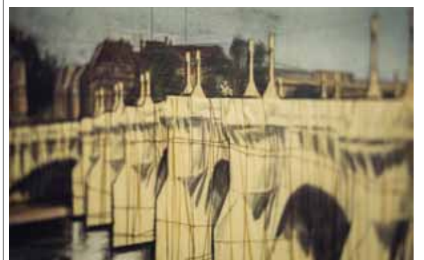
Скица от 1980 г. на проекта „Пон Ньоф“.

оцветени в синьо, червено, бяло и лилаво, върху платформа от пластмасови кубове.