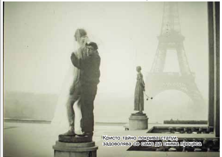
Кристо тайно покрива статуи, задоволява се само да снима процеса

Но професор Финедат невъзможни - опхват 46-километрова ограда от